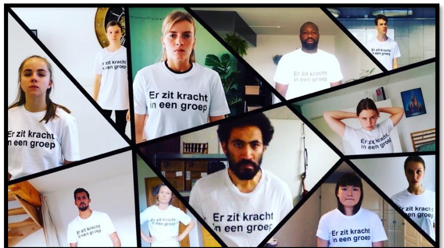
Video still uit de film REVOLT – The Manifest

Het materiaal uit de laboratoria is direct en indirect terecht gekomen in de uiteindelijke voorstelling REVOLT , die Cecilia bij Maas theater en dans maakte. Het gemaakte dansmateriaal was in uitgewerkte vorm terug te zien in de choreografische delen. Een montage van fragmenten uit de interviews werden levensgroot geprojecteerd in de voorstelling en tussen de live scènes door afgespeeld. Ze vormden de ‘echte stem’ van de samenleving en gaven de voorstelling een menselijke, intieme laag.