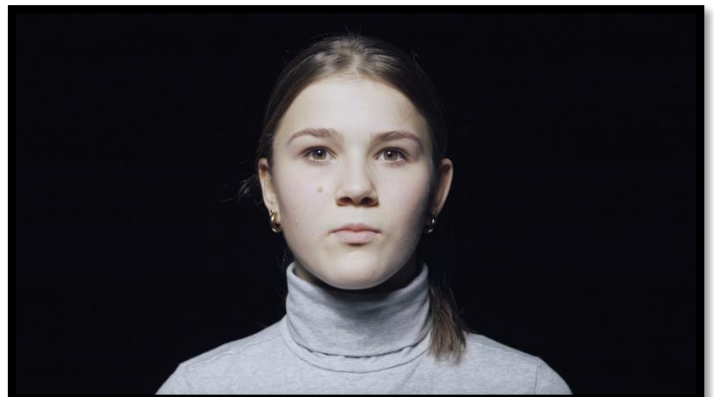
Video stils uit de documentaire REVOLT – The Manifest (Editie Groningen)

In 2021 continueerde het project met de volgende edities van Laboratorium: REVOLT :