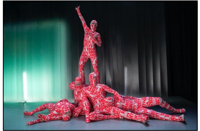
Beelden uit REVOLT .